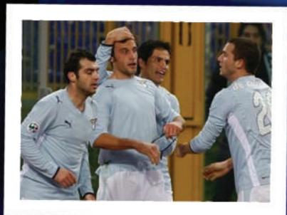
22.01.2009 - Lazio-Torino 3-1 Staccato il pass per la semifinale di Coppa Italia