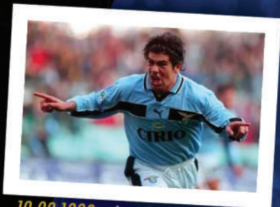
19.09.1999 - Lazio-Torino 3-0 Tris nell'anno dello scudetto