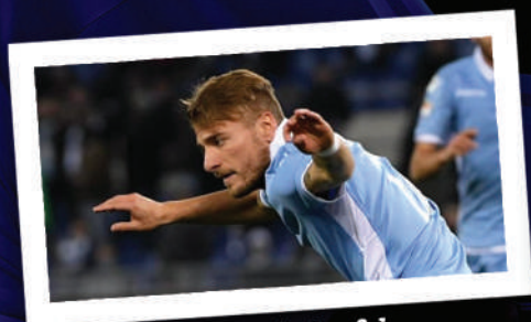
13.03.2017 - Lazio-Torino 3-1 Tris biancoceleste