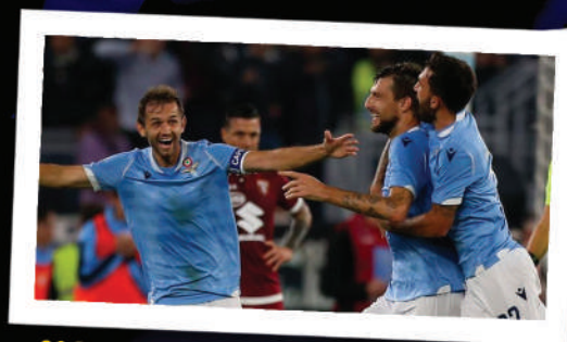
30.10.2019 - Lazio-Torino 4-0 L'ultimo successo contro i granata