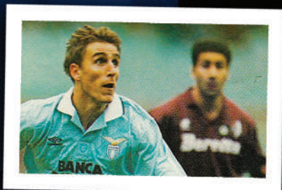
11.09.1994 - Lazio-Torino 3-0 Spettacolo con Signori e Boksic