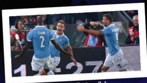
26.01.2014 - Lazio-Torino 2-1 La firma di Klose