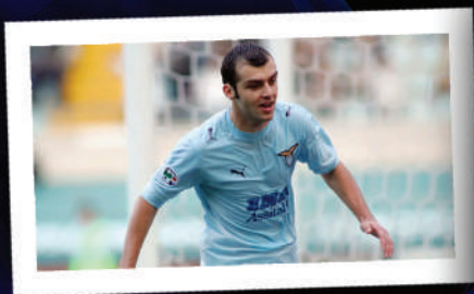
18.02.2007 - Lazio-Torino 2-0 La doppietta di Pandev per piegare il Toro