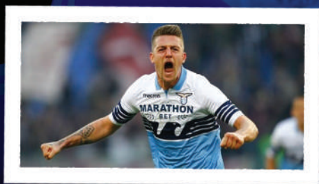
29.12.2018 - Lazio-Torino 1-1 La magia di Milinkovic